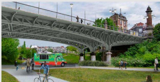
► Pour les travaux, piétons et cyclistes seront renvoyés vers un tunnel sécurisé sous le pont de fin 2024 à mi 2025.