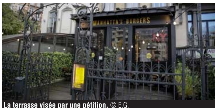
La terrasse visée par une pétition.