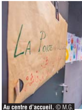
Au centre d'accueil.

dans l'attente d'une politique de prise en charge digne des publics migrants par le gouvernement fédéral. L'absence de vision concertée à moyen terme et les difficultés de dialogue avec le gouvernement fédéral conduisent aujourd'hui à une situation problématique pour les opérateurs de l'accueil et de l'accompagnement », a déploré Alain Maron, à l'issue de la réunion du gouvernement. Le ministre a souligné que le soutien régional « vient donc suppléer l'absence du fédéral afin de réduire la souffrance humaine et les situations de tensions dans les structures qui ne sont pas spécifiquement destinées à accueillir ce type de public ».