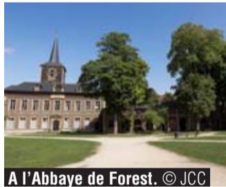
A l'Abbaye de Forest.

La cérémonie de commémoration de l'Armistice se tiendra à 11h au Monument aux Morts au square Omer Denis à Forest et sera suivie d'une conférence donnée par le professeur Thomas Gergely dans la salle des mariages de l'Abbaye de Forest, sur le thème « Devoir de mémoire, devoir de savoir ». ●